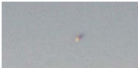
Utsnitt av objekt med sol og skyggeside